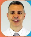
Op.Dr. Mitat Altuğ Göz Vakfı Bayrampaşa Göz Hastanesi

Göz alerjileri her ne kadar baharla özdeşleşmiş olsa da sıcak yaz aylarında da göz alerjilerinin alevlenmesine sebep olabilen birçok faktör bulunur. Yaz aylarında polenler kadar güneş ve havuz suyundaki klorun da göz alerjisi oluşumunda tetikleyici bir rolü bulunmaktadır.